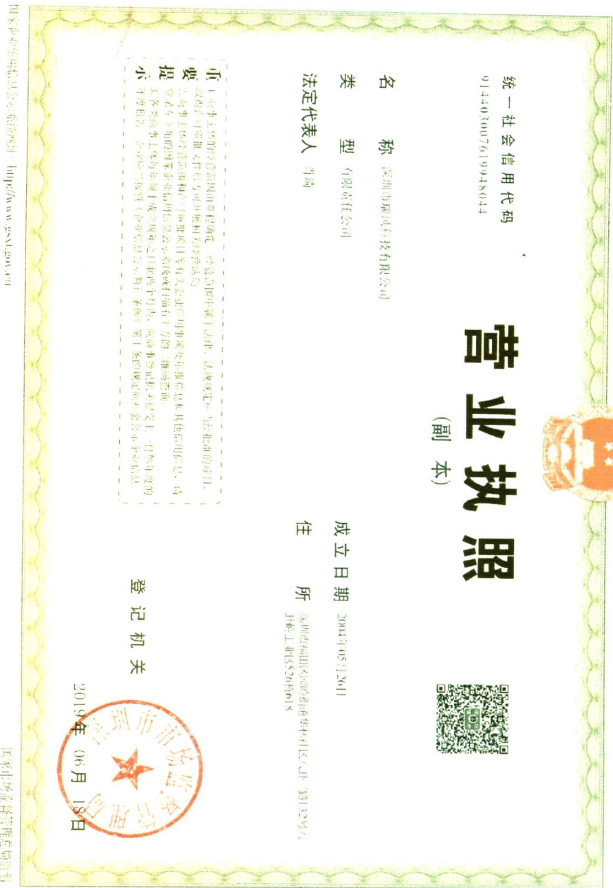
附件 6. 三证：营业执照、医疗器械生产/经营许可证、医疗器械注册/备案证